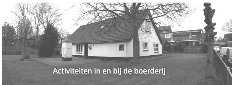
Activiteiten in en bij de boerderij